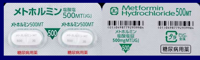
メトホルミン塩酸塩錠 500mg JG