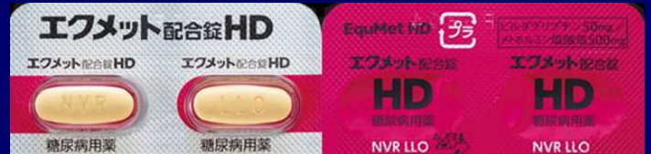
イクメット配合錠 HD