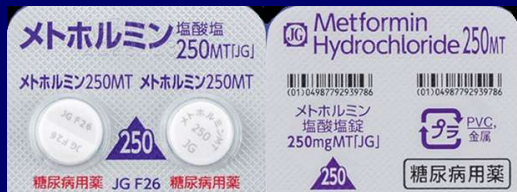
メトホルミン塩酸塩錠 250mg JG