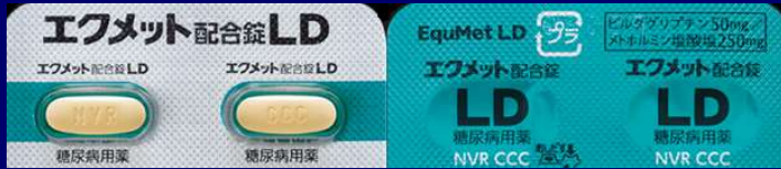
イクメット配合錠 LD