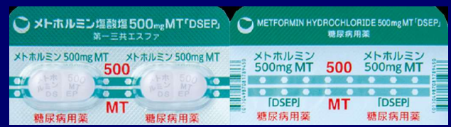
メトホルミン塩酸塩錠 500mg DSEP