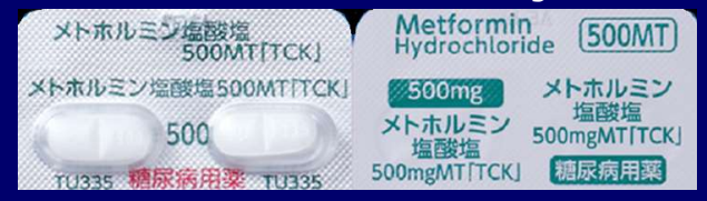
メトホルミン塩酸塩錠 500mg TCK