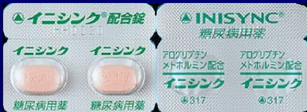
イニシンク配合錠