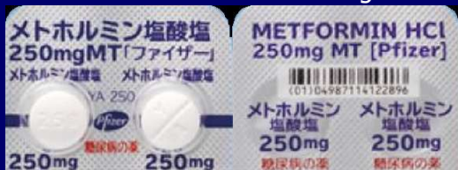
メトホルミン塩酸塩錠 250mg VTRS