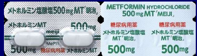
メトホルミン塩酸塩錠 500mg 明治