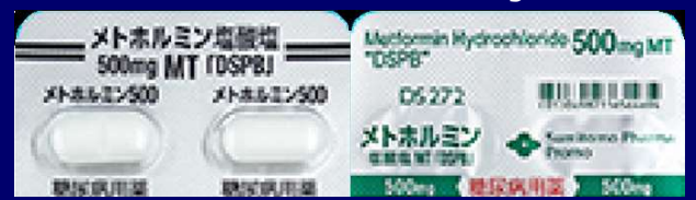
メトホルミン塩酸塩錠 500mg DSPB