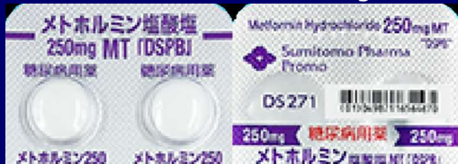
メトホルミン塩酸塩錠 250mg DSPB