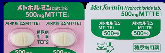
メトホルミン塩酸塩錠 500mg TE