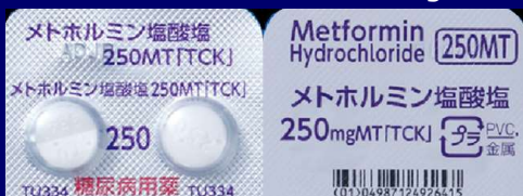
メトホルミン塩酸塩錠 250mg TCK