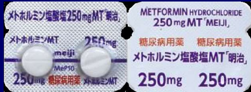
メトホルミン塩酸塩錠 250mg 明治