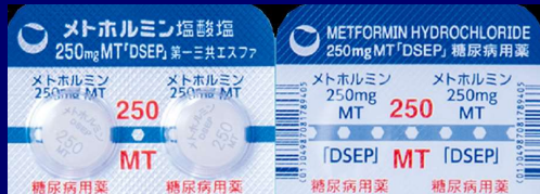
メトホルミン塩酸塩錠 250mg DSEP