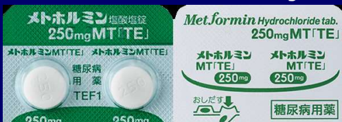
メトホルミン塩酸塩錠 250mg TE